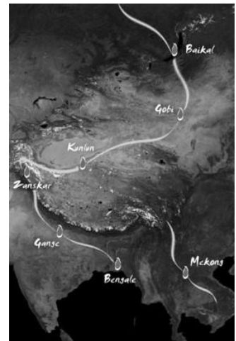
Itinéraire aux confins de l'Asie...

Baïkal Bangkok, au gré des saisons et au fil de l'eau... Ce voyage a provoqué l'eau dans ses extrêmes en me rapprochant des différentes populations qui tentent inlassablement de l'appivoiser. Partager leurs instantanés de vie et les transmettre par la suite, en réponse à notre souci constant de recherche de confort et de facilité... Ce voyage s'est voulu une approche humaine afin de sensibiliser et découvrir les innombrables visages de l'eau : sa beauté, sa préciosité, ses revers, ses secrets... »