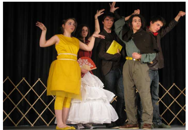
Photos de classes option théâtre 2012/2013 Lycée Jeanne d'Arc à Montaigu (Secondes, Premières et Terminales)