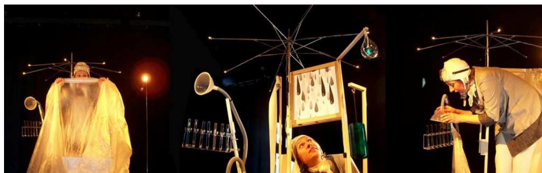
Photos du spectacle Jour de Pluie