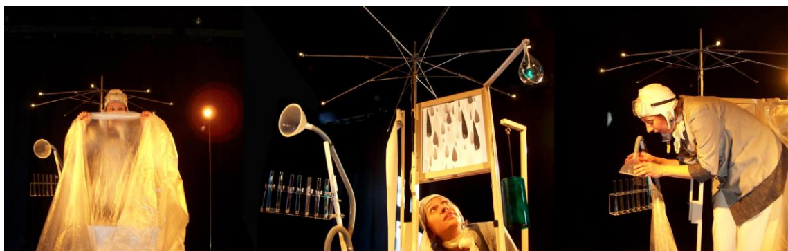
Photos du spectacle Jour de Pluie