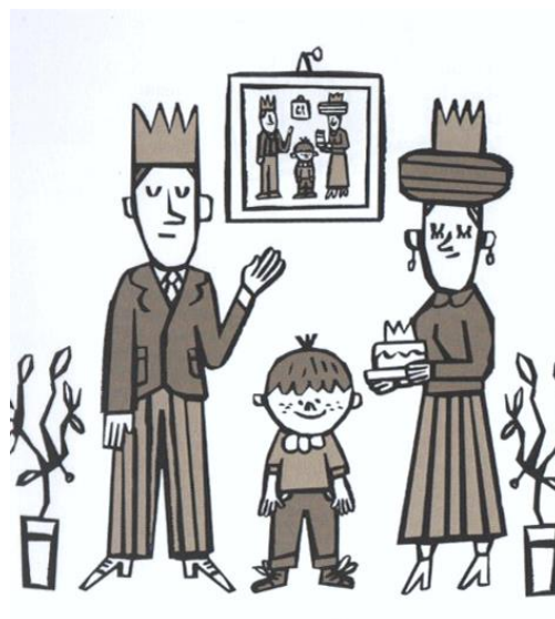
Dessin dans l'ouvrage L'Imparfait d'Olivier Balazuc, illustration de Charles Dutertre © Actes Sud, 2016

Je veux dire. Ça ne pouvait pas être tout à fait parfait puisque je n'y étais pas et même avant quand vous ne vous connaissiez pas est-ce que vous avez tout de suite vu que vous étiez parfaits et d'ailleurs même comment ça aurait pu être parfait puisque ce qui est vraiment parfait c'est Papamamanvictor ? Je veux dire. »