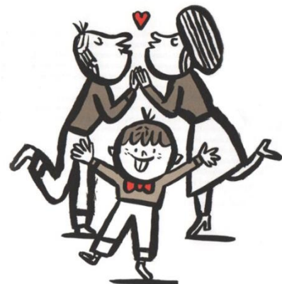
Illustration de Charles Dutertre